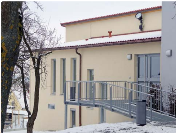
Layout: Jakob Rusch · Fotos: Jakob Rusch, Hans Stoll