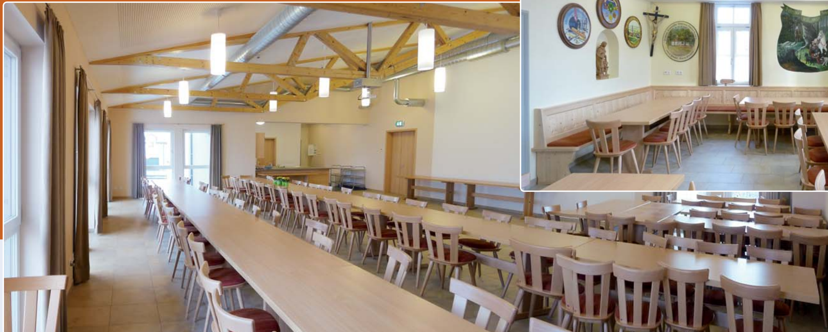
Der Saal für bis zu 140 Personen